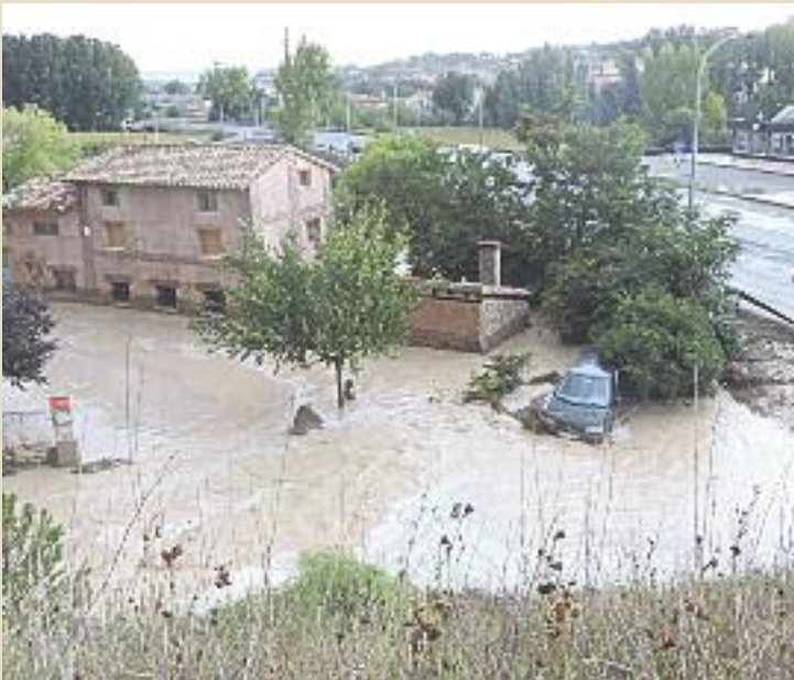
El agua siguió otro curso La alcantarilla por la que pasa la rambla bajo el puente de la Equivocación quedó taponada y el agua discurrió por otro lado.