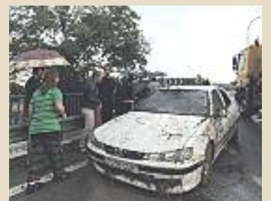
Retirada de vehículos Una gran grúa se empleó para retirar los dos vehículos que quedaron atrapados en la alcantarilla que encauza la rambla de Jorgito.